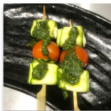
Mozzarella & Zucchini