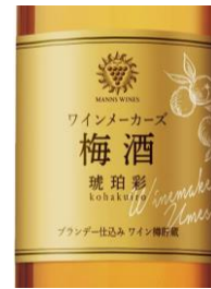
Manns Plum Wine 12,5%