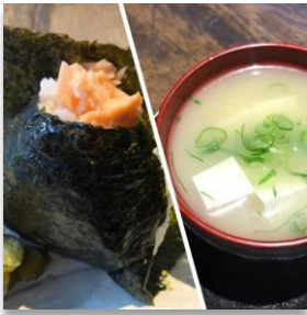
Musubi & Miso Soup