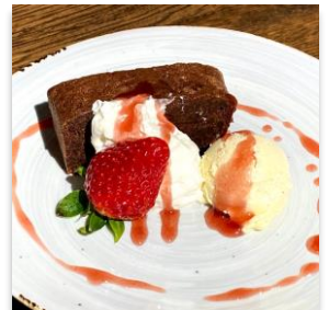
Gâteau au Chocolat