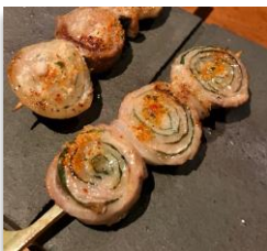
Green Shiso Leaves

1 Pork Belly Roll (your choice) お好きな豚バラ巻き