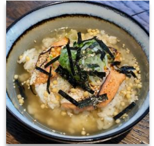
Chicken Soup Rice