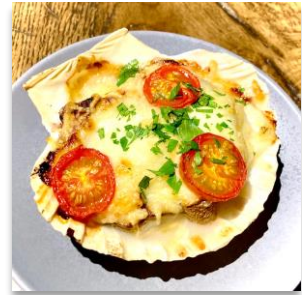
Scallop & Shiitake Gratin