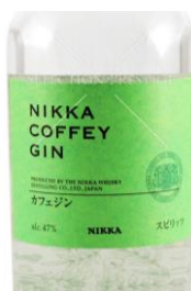
Nikka Coffey Gin 47%