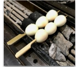
Uzura Tamago Quail Eggs

1 Rib Eye or Thick Cut Pork Belly リブアイ串又は厚切り豚バラ串