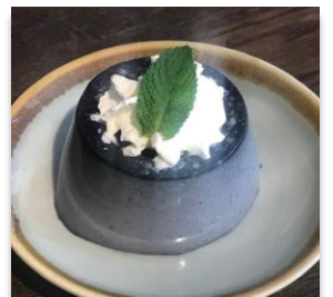
Black Sesame Pudding