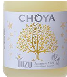
Choya Yuzu 14,7%