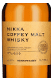
Nikka Coffey Malt Whisky 45%