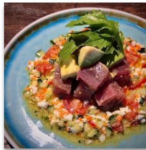
Marinade Tuna & Avocado