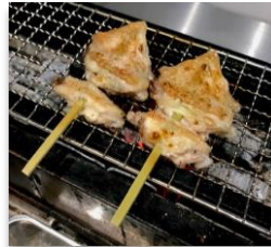
Tebasaki Chicken Wings