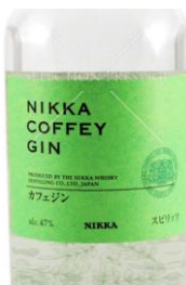
Nikka Coffey Gin 47%