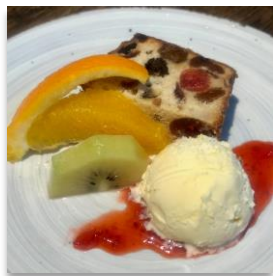
Brandy Fruit Cake