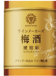
Manns Plum Wine 12,5%