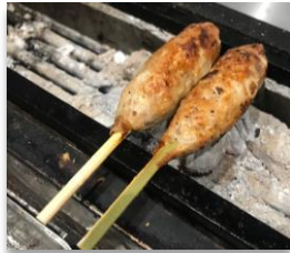
Tsukune Ground Chicken Stick