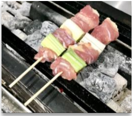
Negima Chicken Thigh with Leeks

3 Chicken Skewers (your choice) お好きな鶏串3本