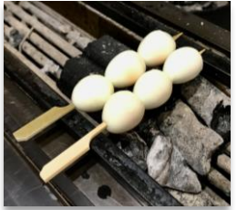
Uzura Tamago Quail Eggs

1 Rib Eye or Thick Cut Pork Belly リブアイ串又は厚切り豚バラ串